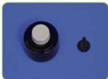
정화통 · 흡입막 · 배기막