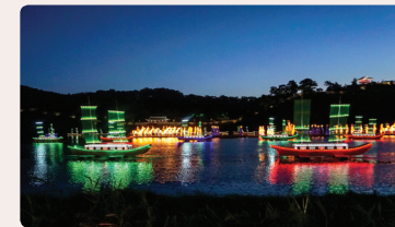
빛과 이야기가 있는 백제등불향연 금강