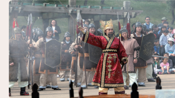
봉황의 태 / 무령왕이야기 9.28(수) 17:00 ~ 금강신관공원 주무대