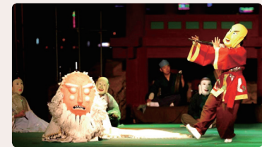
백제어울마당 9.24(토), 10.1(토) _ 공산성, 무령왕릉