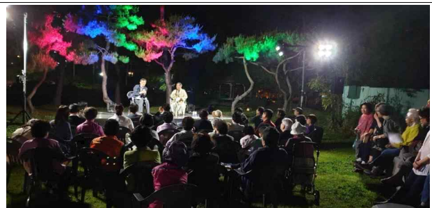
대통사의 비밀을 찾아서