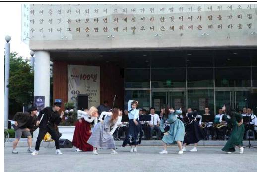
제민천 청춘 고고장