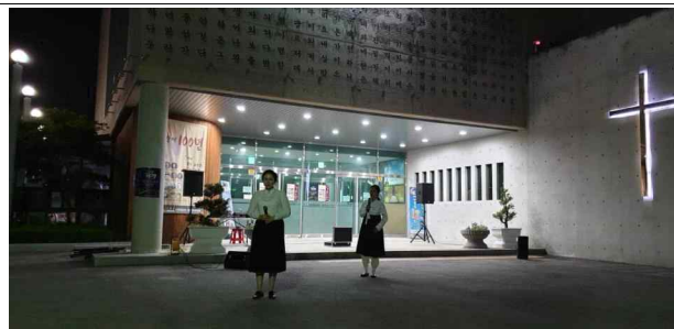
유관순 열사와 사애리시 역사상황극