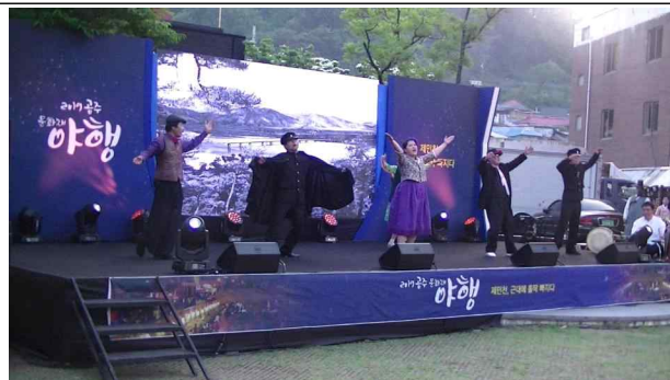
제민천 별빛 음악회 변사 공연