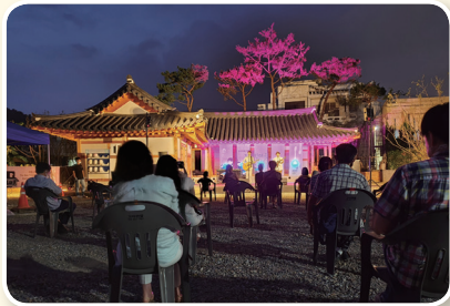
공주하숙마을 지친마음 힐링음악회 개최