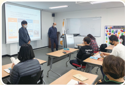
리노베이션 스쿨 in 공주 개최