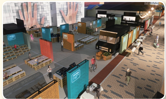
| 공주 야행 골목길 활성화사업 예상도 |