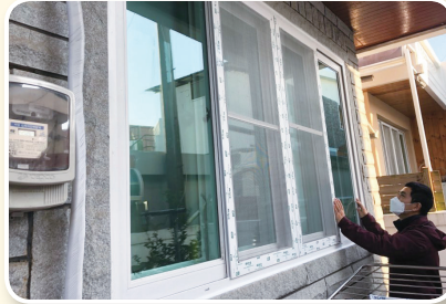
옥룡동 집수리지원사업 시작