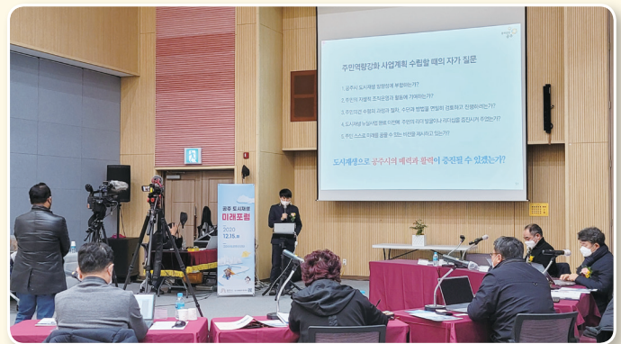
도시재생미래포럼 행사 모습 |

되었다. 또한 토론자들 공통적으로 원도심 콘텐츠 발굴 및 활용을 강조하였다.