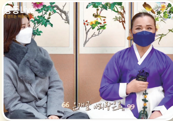
| 옥룡동 마을축제 생중계 모습 |