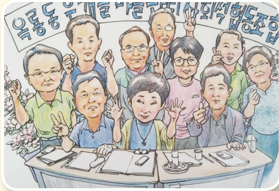
옥룡동 은개골 마을관리 사회적협동조합 국토부 인가