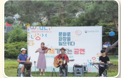
반죽동 '거리에 다가치 모이자' 소규모 재생사업 선정