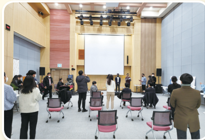
공주 도시재생한마당 개최