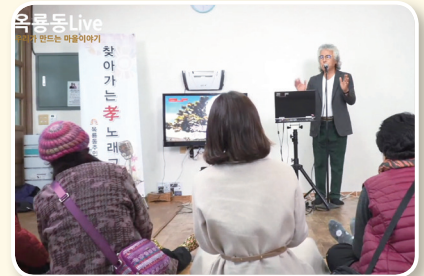
옥룡동 온라인 도시재생마을축제 개최