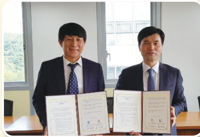
도시재생지원센터-한성대 MOU 체결