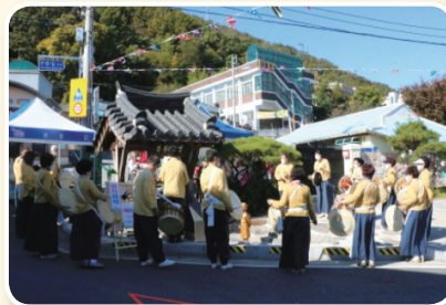
봉황큰샘 마을축제 개최