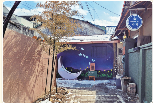
| 루치아 골목길 |

해당 지역에 대한 안내는 도시재생지원센터(858-8615)로 문의하면 된다.