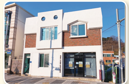
옥룡동 현장지원센터 개소