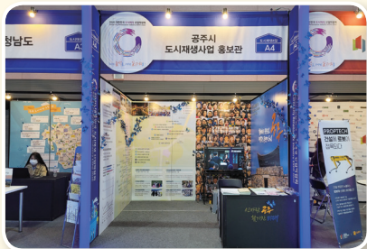
도시재생 산업박람회 '최우수상' 수상