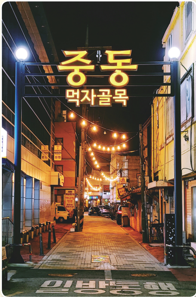
| 밤에 찾은 중동 147 골목 |

한편 이곳은 중학동 도시재생뉴딜사업(중심시가지형)을 통해 공주 야행 골목길 활성화사업이 계획 중이다. 원도심 속 야간 관광이 주목받는 시대이며 이에 발맞춰 역사와 추억이 있는 중동147골목을 야간활동 중심지로 재활성화시키고자 하는 사업이다. 현재 기본계획이 수립되었으며 지난 1월 20일 관련 주민협의체 회원들을 대상으로 주민설명회를 개최하였다. 올해 새로운 원도심 야간명소로 탄생할 중동 147골목을 기대해보자.