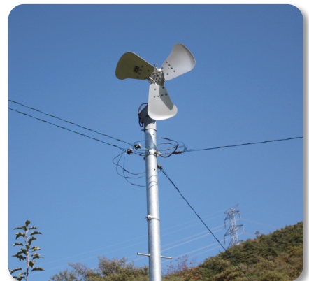
〈방상팬 이용 송풍〉